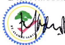
Ir. Akhmad Direktur

SALINAN keputusan ini disampaikan Kepada Yth :